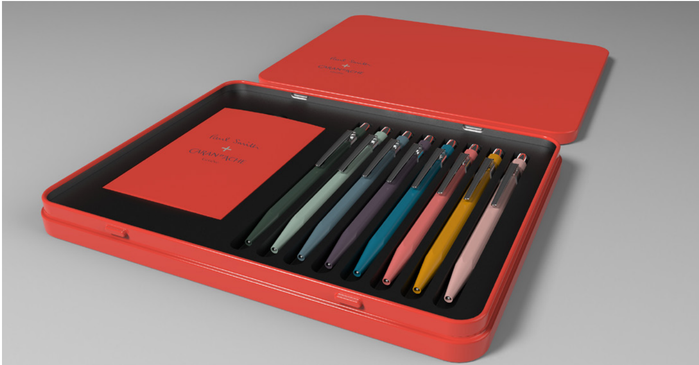
rendu 3D par Alpes Packaging

Ésthétisme est l'un des maîtres-mots du monde de la mode, alors pour approuver le concept à l'équipe de Paul Smith, nous avons réalisé plusieurs rendus photo-réaliste à partir des modélisations 3D sur Solidworks pour un résultat épatant !