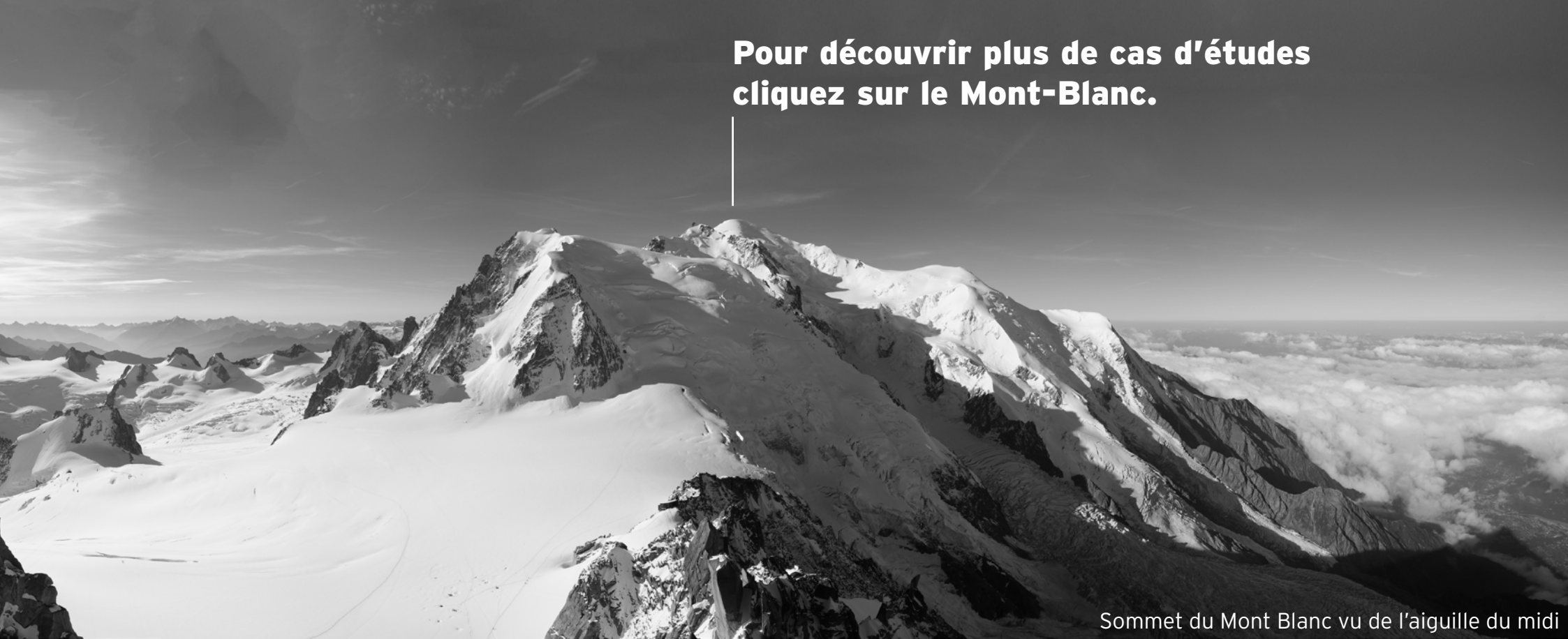
Sommet du Mont Blanc vu de l'aiguille du midi

Pour découvrir plus de cas d'études cliquez sur le Mont-Blanc.